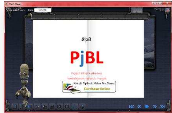
Gambar 5. Tampilan Isi Media Pembelajaran