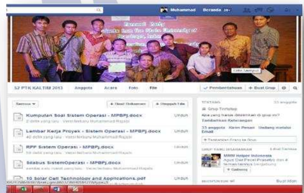
Gambar 6. Penyebaran Perangkat

Tahap disseminate dilakukan dengan menyebarkan perangkat pembelajaran melalui media sosial berupa facebook dengan Group PTK Kaltim 2012. Berikut gambar tampilan penyebaran perangkat pembelajaran melalui media sosial.