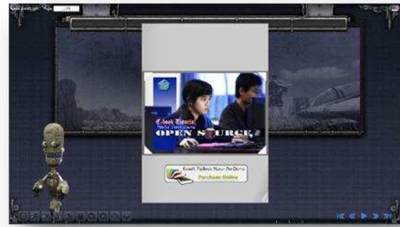
Gambar 4. Tampilan Awal Media Pembelajaran

Adapun media pembelajar berupa buku elektronik ( e-book ) dibuat untuk siswa sebagai pedoman pelaksanaan pembelajaran. Pedoman pelaksanaan pembelajaran ini berguna untuk memperkenalkan dan mengarahkan proses pembelajaran berbasis proyek yang belum pernah dilakukan siswa. Media dibuat dengan perangkat lunak NCESoft Ver 2.8.1 dan ditampilkan dengan Adobe FlashPlayer Ver 9. Bahasa yang digunakan adalah bahasa Indonesia sebagai bahasa pengantar dalam pendidikan dengan warna utama dalam tampilan adalah abu-abu dan berisi 60 halaman. Dalam media tersebut juga terdapat tombol navigasi untuk mengatur setiap halaman yang hendak ditampilkan, pengaturan suara, dan tampilan layar. Berikut gambar tampilan media pembelajaran.