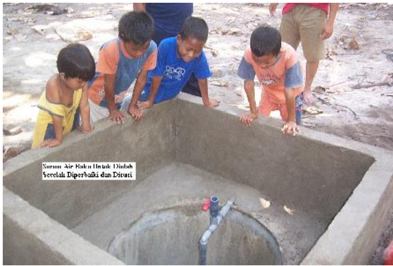
Gambar 4 : Sumur Air Baku Yang Telah diper-baiki dan Dibersihkan dan Siap Untuk Diolah Dengan Instalasi Pengolah Air Asin Menjadi Air Minum.