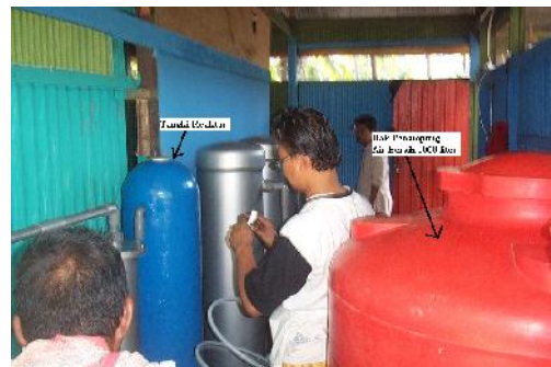
Gambar 8 : Tangki Reaktor dan Bak Penampung Air Bersih Volume 1000 liter.