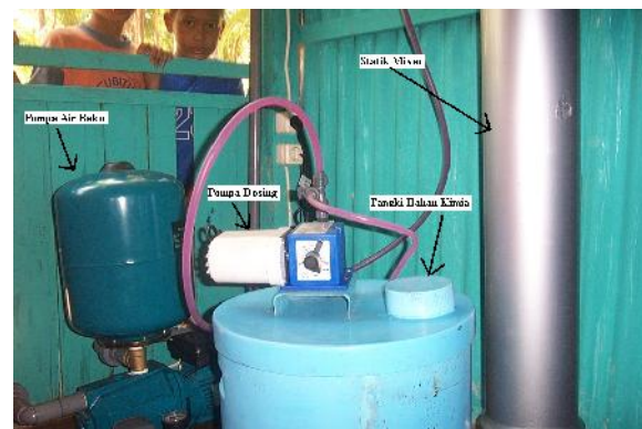
Gambar 6 : Pompa Air Baku, Pompa Dosing, Tangki Bahan Kimia dan Statik Mixer.

Tipe : 100/030 Tekanan : 7 Bars Kapasitas : 4.7 lt/jam Pump head : SAN