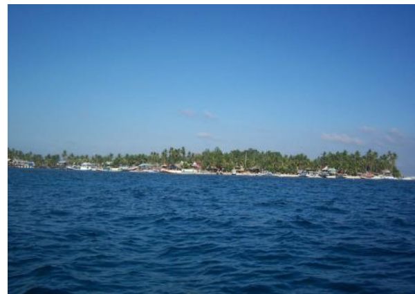
Gambar 2 : Pulau Pandangan, Kabupaten Pangkajene Kepulauan.

Bangunan pelindung menggunakan bangunan pembangkit listrik yang sudah ada, dengan memodifikasi bagian dalam dan menambah lebar ruangan sedikit. Ruangan yang tersedia sekitar 2,5 meter x 6 meter.