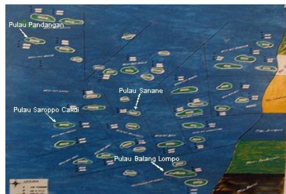
Gambar 1 : Kepulauan Pangkajene Kepulauan, sebelah barat Kabupaten Pangkajene, Utara Makasar, Sulawesi Selatan.

Bermodal pada sifat gotong royong dan kuatnya kepemimpinan, maka sistem pengelolaan air yang ada perlu dikembangkan dan dipercayakan untuk dikelola oleh masyarakat sendiri. Selama ini masalah air bersih di daerah selalu menjadi tanggung jawab PDAM atau dinas pekerjaan umum, namun karena jarak pulau yang jauh dari daratan dan terkadang musim yang tidak bersahabat, maka air bersih di pulau-pulau kurang diperhatikan. Oleh karena itu pengelolaan air bersih berbasis masyarakat perlu dikembangkan agar masyarakat mandiri dan berdaya dalam pengadaan air bersih terutama pada musim kemarau panjang. Jika air bersih tersedia, waktu atau uang yang selama ini tersita untuk mendapatkan air bersih dapat dimanfaatkan untuk keperluan lain dan lebih produktif dan dapat membuat masyarakat lebih sejahtera.