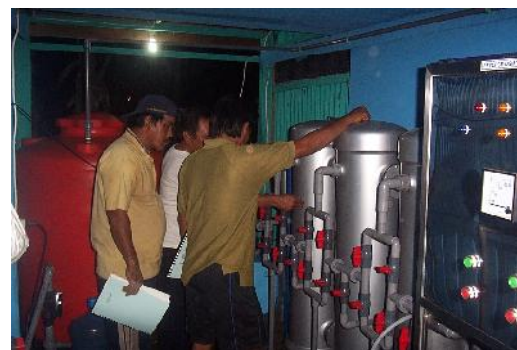
Gambar 9 : Unit Pengolah Air Sistem Osmosa Balik.

Secara kualitatif hasil kegiatan ini dapat meningkatkan taraf hidup masyarakat dengan adanya penyediaan air siap minum yang dijual dengan harga yang sangat murah dibandingkan dengan apabila membeli air kemasan. Selain itu dengan adanya unit alat pengolahan air langsung siap minum tersebut masyarakat tidak perlu lagi memasak air, sehingga dapat menghemat bahan bakar dan mengurangi resiko kebakaran akibat memasak air.