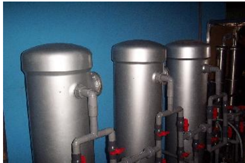
Gambar 7 : Saringan Filter Pasir Silika, Mangan Zeolit dan Pemukar Ion.