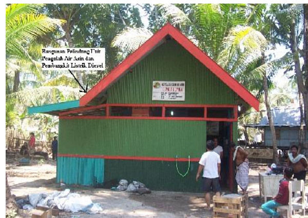
Gambar 3 : Bangunan Pelindung Instalasi Diesel Pulau Pandangan Yang Diperlebar Oleh Masyarakat Sebagai Tempat Pengolah Air Asin.

Air baku yang akan digunakan untuk pengolahan digunakan dari sumur penduduk yang berada ditengah pulau, yang airnya payau. Sebelum digunakan sumur terlebih dahulu dibersihkan dan dilakukan pengurusan dan pengujian kapasitas, untuk memastikan tidak akan terjadi kekurangan air pada sistem pada saat berjalan.