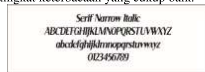
Gambar 9 Font Serif Narrow Italic

Untuk bagian sub judul, buku ini menggunakan font bernama Serif Narrow Italic . Pemilihan font ini didasarkan pada bentuknya yang tegas dan dinamis dengan tingkat keterbacaan yang cukup baik.