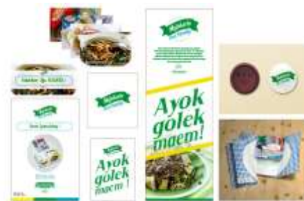
Gambar 14 Desain media pendukung

Media promosi ini tentunya digunakan untuk menunjang agar target audiens dapat menyadari keberadaan buku ini. Media ini dibuat seragam agar audiens dapat dengan mudah mengenalinya. Media yang dibuat adalah postcard , x-banner , Stiker, Poster , pin, brosur, dan Voucher yang masing-masing medianya sudah dijelaskan pada pembahasan sebelumnya.