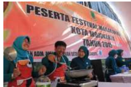
Gambar 1 Penyelenggaraan Festival Masakan Khas Kota Mojokerto 2015

Keseriusan Pemerintah kota Mojokerto dalam menjadikan Mojokerto sebagai kota wisata kuliner ini dapat dibuktikan dengan terselenggaranya beberapa festival yang ada hubungannya dengan kuliner. Diantaranya adalah, Festival Masakan Khas Kota Mojokerto (gambar 1), Pesta Gizi 2015 Tusuk Sate (gambar 2), dan Kenduri Maulid 5000 Layah. Tentunya dengan harapan kegiatan seperti ini dapat diselenggarakan rutin setiap tahunnya.