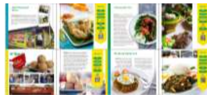
Gambar 13 Desain layout isi buku