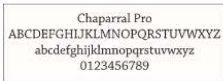
Gambar 10 Font Chaparral Pro