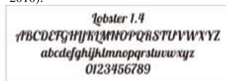
Gambar 8 Font Lobster 1.4

Font yang digunakan dalam buku ini adalah font bernama Lobster 1.4 yang diaplikasikan pada judul buku. Pemilihan font ini disarankan pada bentuk font yang bersifat dekoratif, luwes dan cukup tebal untuk sebuah judul. Jenis huruf display sangat dibutuhkan dunia periklanan untuk menarik perhatian pembaca (Rustan, 2010).