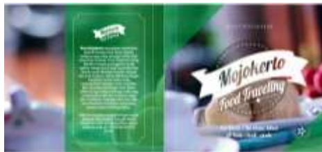
Gambar 11 Desain Cover Buku

Cover depan dipilih dari sketsa alternatif yang terbentuk dari forum group discussion kepada masyarakat awam dan mahasiswa desain komunikasi visual STIKOM Surabaya. Pemilihan font menggunakan font Lobster 1.4 pada judul utama yang luwes bertuliskan “Mojokerto Food Traveling” dengan sub headline Berburu Cita Rasa Khas di Kota Onde-onde”. Ilustrasi background menggunakan foto makanan khas Mojokerto.