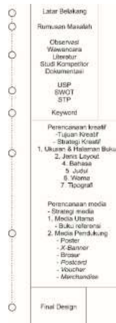
Gambar 6 Perancangan karya

Konsep perancangan karya merupakan rangkaian perancangan yang didasarkan melalui konsep yang telah ditemukan dan kemudian rangkaian ini akan digunakan secara konsisten di setiap hasil implementasi karya. Konsep perancangan buku referensi wisata kuliner di kota Mojokerto ini dapat dilihat pada gambar 4.22