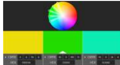
Gambar 7 Pilihan warna

analisis dengan menggunakan keselarasan warna analogous (Kemiripan) dengan menggunakan adobe color dan ditemukan warna kuning dan tosca seperti yang ada pada gambar 7.