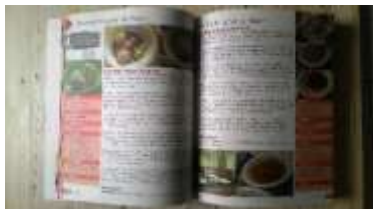
Gambar 4 Isi buku Jalur Enak Serpong

Kekuatan dari buku ini adalah penyajian informasi destinasi wisatanya yang cukup lengkap yaitu lebih dari 100 destinasi wisata kuliner.