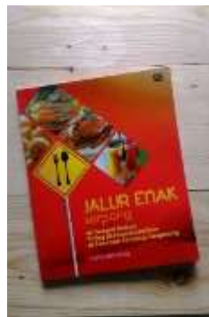
Gambar 3 Cover buku Jalur Enak Serpong