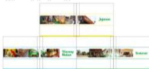
Gambar 12 Desain Halaman bab

Halaman bab ini berfungsi untuk menjadi pembatas diantara kategori-kategori yang ada. Ada beberapa jenis kategori diantaranya yaitu, Restoran, Warung Makan, dan Jajanan.