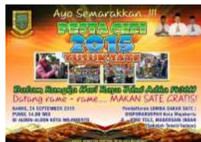
Gambar 2 Desain poster Pesta Gizi 2015 Tusuk Sate