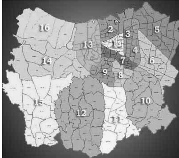
Gambar 1.2. Peta adminstrasi kota Semarang

Kota Semarang adalah satu di antara kota-kota besar di Indonesia dan menjadi ibukota Propinsi Jawa Tengah. Luas daerah administrasi 373,7 Km 2 , terdiri dari 16 kecamatan dan 117 kelurahan, mempunyai letak geografis yang strategis sebagai pusat pemerintahan. Peta administrasi Kota Semarang dapat di lihat pada (Gambar 1.2).