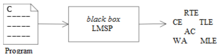
Gambar 2 Skema pengujian grader .