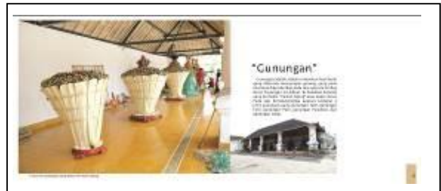
Gambar 10 Halaman Gunungan

Pada gambar 10 menjelaskan gunungan adalah syarat utama dari upacara grebeg besar, dan dijelaskan dimana gunungan tersebut dibuat dan gunungan apa saja yang akan dibuat pada saat upacara grebeg besar berlangsung.