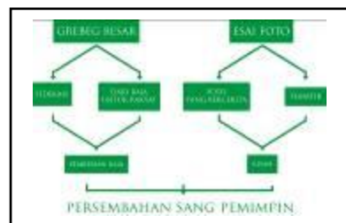
Gambar 1 Proses Penentuan Final Keyword

Bedasarkan dari pencarian kata kunci diatas ditemukan keyword untuk Penciptaan Buku Esai Fotografi Upacara Grebeg Besar Yogyakarta Sebagai Upaya Mempopulerkan Filosofi Budaya Jawa adalah “Persembahan Sang Pemimpin”. Keyword ini akan dijadikan sebuah konsep yang akan mendasari Penciptaan Buku Esai Fotografi Upacara Grebeg Besar Yogyakarta. Bisa dilihat pada gambar 4.1 proses penentuan final keyword untuk penciptaan buku esai fotografi grebeg besar Yogyakarta.