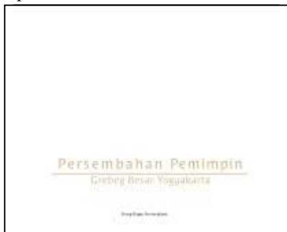
Gambar 5 Halaman Pembuka

Halaman pembuka merupakan konten paling awal yang ditemui oleh audience yang memcoba pada saat membuka buku. Pada halaman ini terdapat repetisi atau pengulangan pada cover sehingga membantu penguatan karakter dari buku dengan penambahan atau pengurangan elemen yang dianggap perlu. bisa dilihat pada gambar 5 untuk halaman pembuka pada buku.