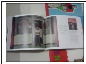
Gambar 2 Referensi layout foto