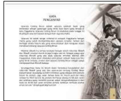
Gambar 6 Kata Pengantar

Sebagai narasi pengantar bagi pembaca dalam memahami isi dari buku. Halaman ini mencakup pandangan dari penulis terhadap fenomena saat ini yang melandasi perancangan buku, body copy disusun secara sistematis guna menunjang penyampaian secara verbal.