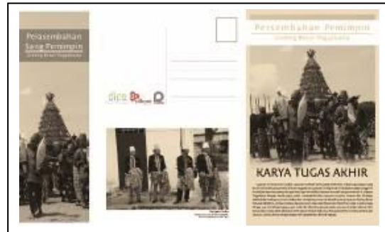
Gambar 11 Implementasi Desain Media Publikasi

Implementasi desain media publikasi atau media pendukung dari buku ini adalah mini L-Banner, post card , dan pembatas buku..