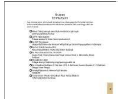
Gambar 7 Ucapan Terima Kasih

Pada gambar 7 ini berisi ucapan syukur kepada pihak-pihak terkait yang telah membantu dan memfasilitasi penulis, baik secara langsung maupun tidak langsung selama proses perancangan buku esai fotografi Grebeg Besar. Untuk menghormati pihak-pihak terkait maka desain pada halaman ucapan terima kasih harus terkesan formal.