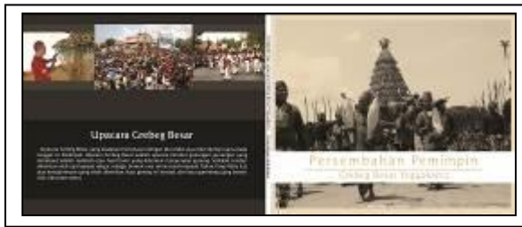
Gambar 4 Cover Buku

desain cover keseluruhan memiliki latar belakang warna hitam, pada bagian depan cover terdapat sekelompok abdi dalem yang membawa gunung-jaler menuju Masjid Gede Kauman. Di bagian belakang cover disertakan ringkasan atau synopsis buku yang dapat memberikan gambaran secara umum pada audience tentang konten yang terdapat dalam buku. Disertai dengan foto-foto proses Upacara Grebeg Besar.