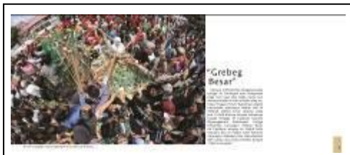
Gambar 9 Grebeg Besar

Pada Gambar 9 menjelaskan pengertian dari grebeg besar Yogyakarta secara umum mulai dari kapan dilaksanakannya grebeg besar, dimana tempatnya dan waktu pelaksanaan grebeg besar Yogyakarta.