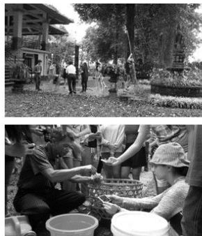
Gambar 6. Pemberian Layanan Program Pendidikan Lingkungan Gratis Bagi Para Siswa Sebagai CSR Kebun Raya “Eka Karya” Bali Tahun 2015