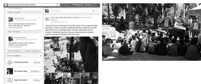
Gambar 3. Promosi Program Pendidikan Lingkungan Kebun Raya “Eka Karya” Bali Melalui Media Sosial dan Media Audio Visual