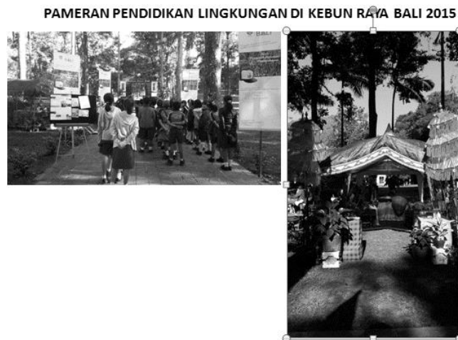
Gambar 4. Pameran Pendidikan Lingkungan Di Kebun Raya “Eka Karya” Bali 2015 Bertajuk “Lets Learn and Play in Nature”

Kebun Raya “Eka Karya” Bali menyelenggarakan pameran pendidikan lingkungan hidup pada tanggal 18 Mei s/d 16 Juni 2015 dengan tema adalah “Lets Learn and Play in Nature” yang bertujuan untuk mengenalkan program tersebut kepada publik sekaligus sebagai strategi awareness Kebun Raya “Eka Karya” Bali. Pameran pendidikan lingkungan hidup diselenggarakan bertepatan dengan momentum liburan sekolah, karena pada bulan Mei-Juni adalah puncak kunjungan siswa di Kebun Raya “Eka Karya” Bali.