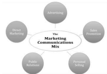
Gambar 1. Marketing Communications Mix

tersebut saling terkait untuk mendukung pencapaian output dan outcome komunikasi seperti yang diharapkan oleh Kebun Raya Bali.