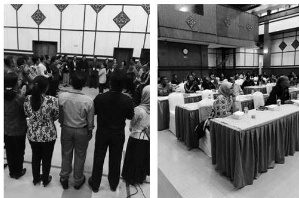
Gambar 5. Penyelenggaraan Workshop Pendidikan Lingkungan Bagi Stakeholder Kebun Raya “Eka Karya” Bali 2015