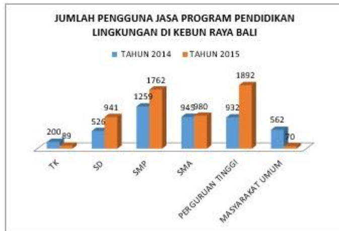
Gambar 7. Jumlah Pengguna Jasa Pendidikan Lingkungan Hidup Kebun Raya “Eka Karya” Bali Mengalami Peningkatan Signifikan Dari Tahun 2014 dan 2015

Karya” Bali. Sebanyak 76,9% sekolah yang telah mengikuti workshop program pendidikan lingkungan hidup di Kebun Raya “Eka Karya” Bali mengambil keputusan untuk berkunjung secara berkelanjutan ke Kebun Raya “Eka Karya” Bali dengan mengajak siswanya mendalami pengetahuan pendidikan lingkungan hidup.