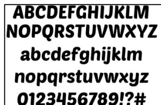
Gambar 4.1 Font Poetsen One

Jenis huruf yang akan digunakan pada papan permainan ini adalah jenis font hand drawn dan sans serif. Font Poetsen One akan digunakan dalam papan permainan karena jelas dan mudah untuk dibaca. Kesan yang ditimbulkan oleh huruf jenis sans-serif ini adalah modern, kontemporer dan efisien.