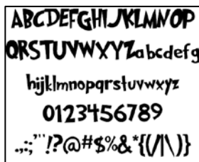
Gambar 4.2 Font Grinched 2.0

Sedangkan untuk judul papan permainan digunakan font lain yang akan digunakan dalam papan permainan ini adalah font Grinched 2.0. Font jenis ini sangat cocok karena memiliki karakter yang mudah dibaca untuk anak. Penggunaan jenis font ini akan memunculkan kesan akrab.