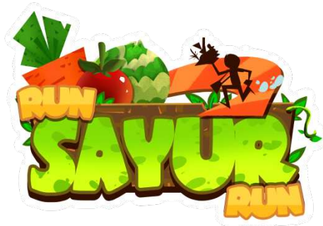
Gambar 4.3 Logo Judul Papan Permainan