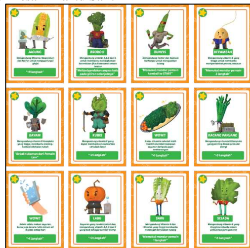
Gambar 4.6 Desain Kartu Bagian Belakang

Pada gambar 4.6 menampilkan desain kartu sakti bagian depan dengan tema warna hijau dan simbol bintang dari yang berada di pojok kiri atas, dengan gambar karakter sayuran. Disertai dengan penjelasan manfaat dari sayuran. Dibagian bawah terdapat instruksi kartu sebagai bagian dari permainan