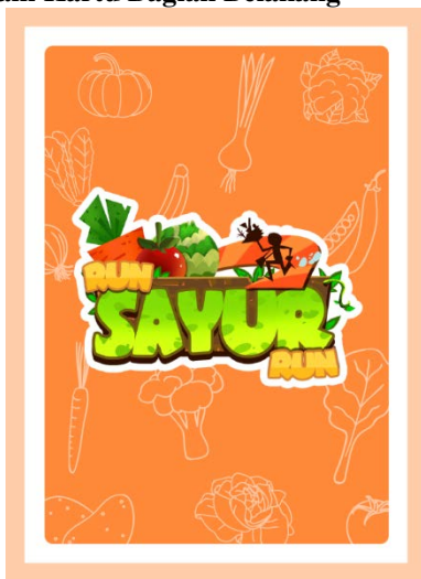
Gambar 4.5 Desain Kartu Bagian Belakang

Pada gambar 4.5 desain kartu permainan bagian belakang dengan menempatkan logo permainan ditengah, ditambah dengan latar belakang warna orange. Agar lebih kontras dengan papan permainan saat dimainkan.