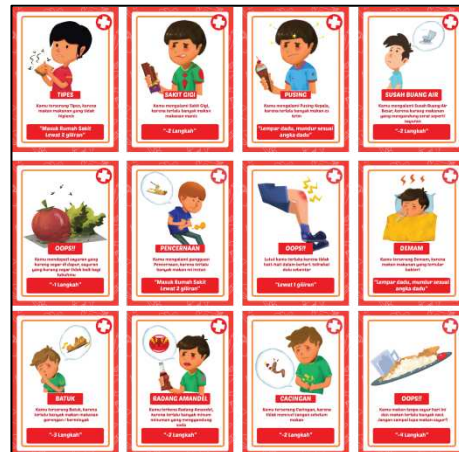
Gambar 4.7 Desain Kartu Bagian Belakang

Pada gambar 4.7 menampilkan desain kartu sakit dengan tema berwarna merah dengan simbol tanda plus berada di pojok kanan atas, dengan gambar karakter anak, menggambarkan situasi sedang sakit. Disertai dengan penjelasan singkat sakit yang dialami dan sebabnya. Dibagian bawah terdapat instruksi kartu sebagai bagian dari permainan.