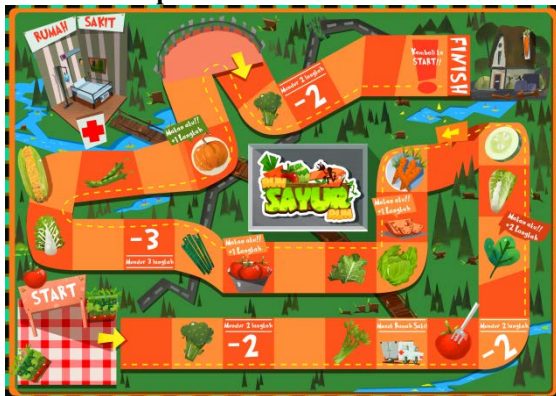
Gambar 4.4 Desain Papan Permainan

Pada gambar 4.4 Desain papan permainan mengambil referensi dari papan permainan ular tangga dan monopoli. Didalam petak terdapat ilustrasi sayuran dan tulisan yang melengkapi permainan. Dan juga terdapat kamar rumah sakit sebagai komponen pelengkap, ilustrasi pohon dan jalan disekitar petak juga bagian dari komponen papan permainan. Warna yang digunakan adalah warna dengan palet bright berdasarkan keyword yaitu Close atau akrab.