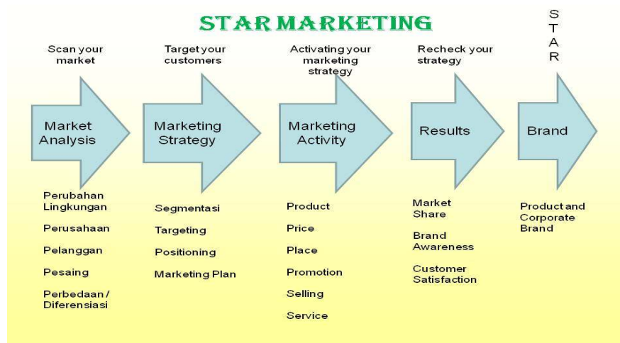
Gambar 1 Star Marketing

Anatomi STAR Marketing sebagai berikut :