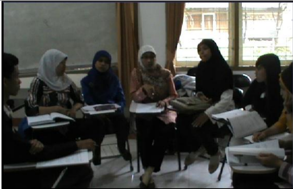
Gambar 4. Refleksi Pembelajaran (See) Oleh Tim Lesson Study

Refleksi Open Lesson I : (1) Penggunaan media power point sangat membantu dalam pembelajaran. (2) Mendatangi mahasiswa yang kurang memperhatikan dan memberi pertanyaan pancingan agar dia kembali konsentrasi dalam pembelajaran. (3) Mempersiapkan alat-alat tulis yang baik sehingga pada saat pembelajaran tidak mengganggu jalannya pembelajaran. (4) Ketika memberikan apersepsi sebaiknya membahas pekerjaan rumah pada pertemuan sebelumnya. (5) Langkah-langkah pembelajaran dalam Rencana Pelaksanaan Pembelajaran (RPP) dalam harus mencerminkan sintaks model pembelajaran yang digunakan. (6) Mengerjakan terlebih dahulu tugas atau soal latihan yang akan diberikan kepada mahasiswa, sehingga dapat mengukur kesiapan dan menambah kepercayaan diri kita sebagai dosen model dihadapan mahasiswa. (7) Memberi tugas terkait materi yang akan dipelajari. Hal ini bertujuan agar pada saat pembelajaran di kelas nantinya mahasiswa sudah membaca materi yang akan diajarkan sehingga sudah siap mengikuti pelajaran.