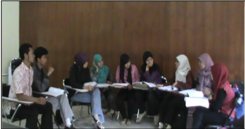
Gambar 2. Perencanaan Pembelajaran (Plan) Oleh Tim Lesson Study

pelaksanaan pembelajaran di kelas nantinya. Pembahasan ini bertujuan agar dosen model mendapat saran dan masukan dari anggota tim Lesson Study lainnya yang sudah mengajar terlebih dahulu di kelas. Pemilihan model pembelajaran juga berdasarkan hasil observasi ketika dosen model lain mengajar.