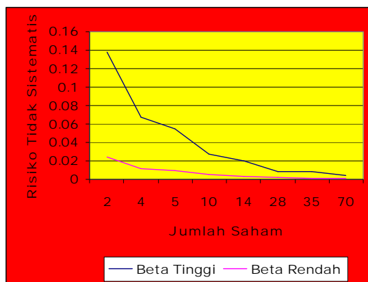
Gambar 3. Perbandingan Risiko Sistematis Portofolio Beta Tinggi dan Beta Rendah

Selanjutnya gambar 3 yang diderivasi dari table 11 memperlihatkan keterkaitan antara besarnya beta saham-saham yang membentuk portofolio dengan resiko tidak sistematis portofolio. Dengan menambah jumlah saham yang menjadi anggota portofolio menyebabkan resiko tidak sistematis semakin menurun, resiko tidak sistematis portofolio yang saham-sahamnya memiliki beta tinggi menghasilkan resiko tidak sistematis yang lebih tinggi dibandingkan dengan portofolio yang saham-sahamnya memiliki beta rendah.