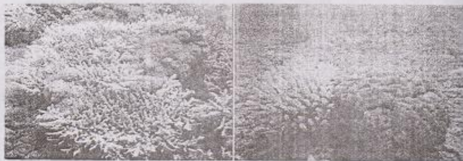
Gb. Pemutihan koloni karang tahun 1998 di Sri langka (Westmacott 2002)

El Nino merupakan peristiwa penurunan suhu secara global di air laut dalam Wilkinson, 2000) Tahun 1983 adalah tahun tercatatnya El Nino terkuat hingga saat itu, diikuti oleh peristiwa serupa tahun 1987 dan yang kuat lagi tahun 1992 (Goreau dan Hayes, 1994). Pemutihan karang telah muncul pula di tahun yang bukan merupakan tahun-tahun El Nino, dan telah dikenali sebagai factor lain selain naiknya SPL yang dapat terkait, seperti angin, awan yang menutup dan hujan (Brown, 1997).