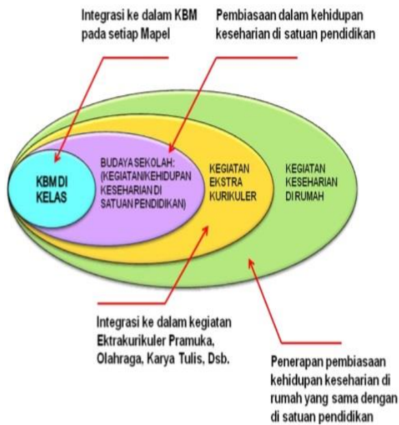
Gambar 2. Pendidikan Karakter Tatanan Mikro (Kemdiknas, 2010: 28)

seperti upacara maupun kegiatan keseharian di sekolah. Hal ini sesuai dengan desain pendidikan karakter karakter mikro oleh Kemdiknas (2010: 28), bahwa: