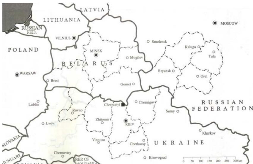
Gambar 2. Wilayah administratif di sekitar reaktor Chernobyl.

Lebih dari 5 juta orang yang bertempat tinggal di beberapa daerah di Negara Belarus, Rusia dan Ukraina dengan tingkat aktivitas ^{137}\text{Cs} lebih dari 37 \text{ kBq/m}^2 , dan mereka dikategorikan sebagai penduduk yang terkontaminasi radionuklida. Di antaranya, sekitar 400.000 orang bermukim di daerah dengan tingkat kontaminasi lebih tinggi, yaitu di atas 555 \text{ kBq/m}^2 ^{137}\text{Cs} yang disebut sebagai daerah strict radiation control . Dari populasi tersebut, hanya sekitar 116.000 orang yang dievakuasi pada tahun 1986 dari daerah sekitar reaktor Chernobyl yang dikenal dengan istilah exclusion zone ke daerah yang tidak terkontaminasi. Sedangkan 220.000 orang lainnya dipindahkan secara bertahap pada tahun berikutnya.