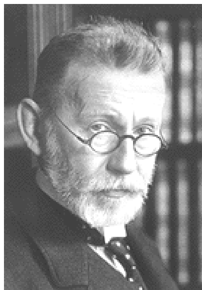
Gambar 1. Paul Ehrlich, penggagas konsep magic bullet dan penerima hadiah nobel kedokteran pada tahun 1908.[2]

pengembangan metode diagnosis dan terapi kanker. [3]