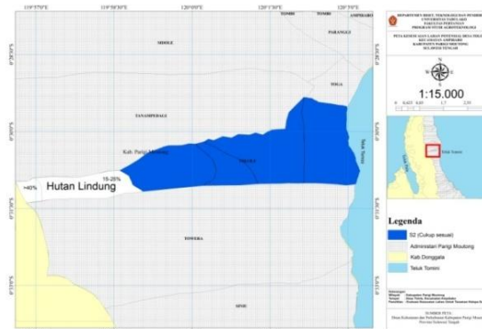
Gambar 3. Peta Kesesuaian Lahan Potensial.