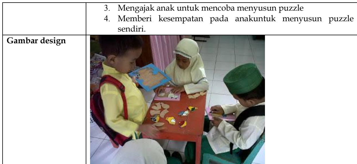
Tabel 2 Table Design Media Pembelajaran