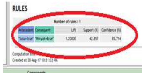
Gambar 2. Pengujian dengan Rules dari pola kombinasi Itemsets

Untuk membuktikan data-data yang telah dihasilkan berupa pola hubungan kombinasi antar items dan rules-rules asosiasi sesuai dengan Algoritma Apriori maka perlu dilakukan pengujian dengan menggunakan suatu aplikasi. Aplikasi yang digunakan adalah Tanagra versi 1.4 , dengan hasil rule dapat kita lihat pada gambar 2.