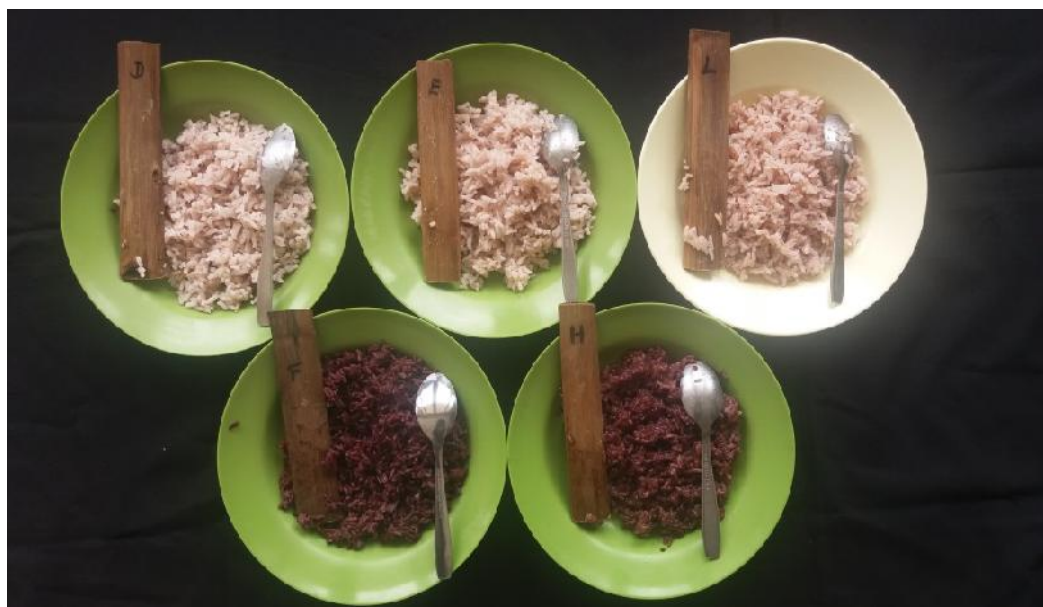
Gambar 4. Nasi galur harapan (GH) beras merah dan hitam: D. GH beras merah aromatik; E. GH beras merah; L. Inpari 24 Gabusan; G. GH beras hitam; H. GH ketan hitam.