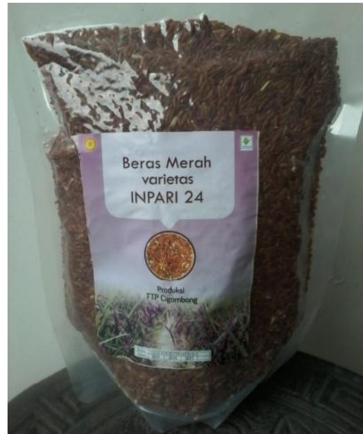
Gambar 3. Kemasan 1 kg kedap udara beras merah Inpari 24 Gabusan. Produksi TPP Cigombong/Balitbangtan.

Beras merah dalam kemasan 0,5 kg kedap udara yang diproduksi oleh petani di Demak, Jawa Tengah, telah diperdagangkan ke Semarang, Jakarta, Bandung, Sumatera, dan Kalimantan (Heri S., komunikasi pribadi),