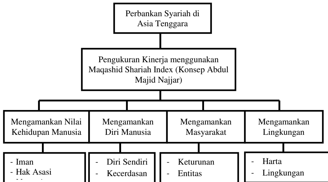
Gambar 1 Skema Kerangka Pemikiran