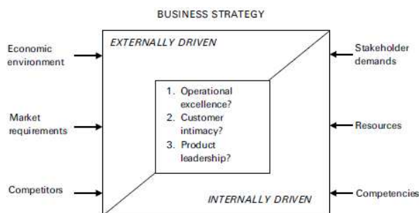
Gambar 1. Bentuk umum Resource Based View Strategy

Strategi ini melihat dari berbagai aspek seperti aspek dorongan eksternal yang terdiri dari lingkungan ekonomi, kebutuhan pasar, dan kompetisi dengan penyedia layanan serupa. Lalu dari aspek dorongan internal terdiri dari permintaan pemangku kepentingan, sumber, dan kompetensi. Seperti terlihat pada gambar dibawah ini.