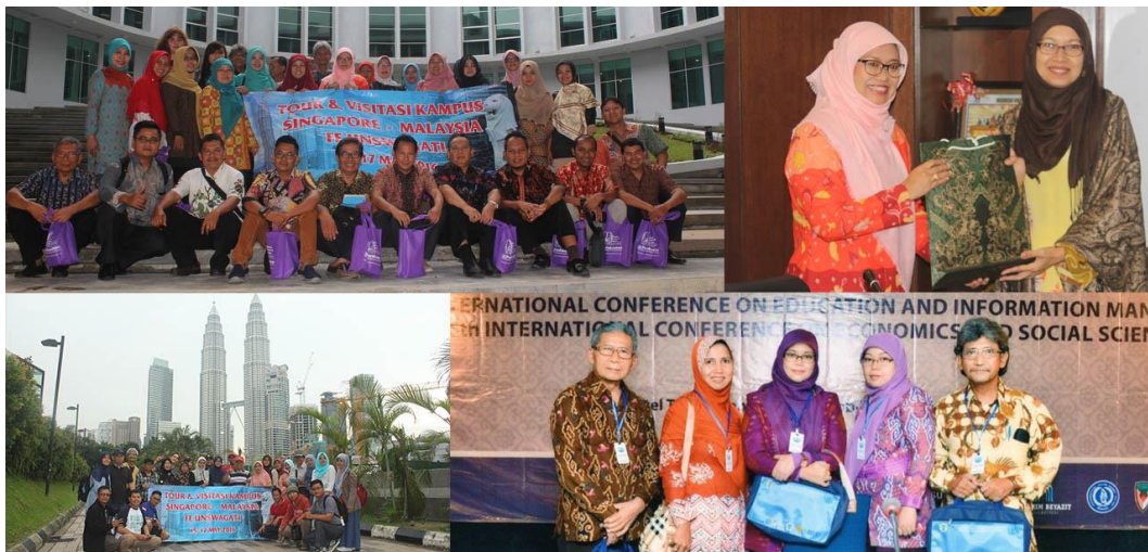
Gambar Kunjungan Luar Negeri Dosen Fakultas Ekonomi Unswagati ke Universitas Mara Malaysia