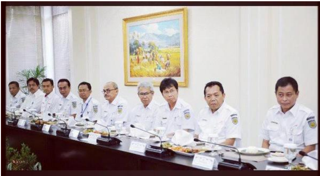
Gambar Rapat Kerja PT. Kereta Api Indonesia (KAI)