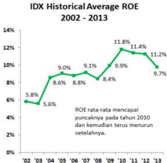
Gambar 1. Profitabilitas Periode Tahun 2002-2013

Data penurunan profitabilitas pada perusahaan di Indonesia dapat dilihat pada gambar 1 dan gambar 2 berikut ini: