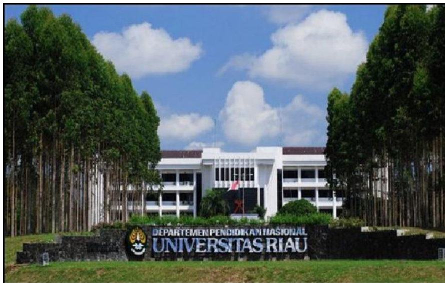
Gambar Gedung Kampus Universitas Riau https://quipper-video-wordpress.s3.amazonaws.com/images/2017/04/pic_bilding.jpg