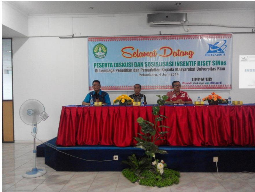
Gambar Kegiatan Diskusi dan Sosialisasi Insentif Riset Nasional di Universitas Riau http://lppm.unri.ac.id/wp-content/uploads/2015/06/IMG_20150604_095313.jpg

Motivasi : Expectancy Theory dan Produktivitas Penelitian