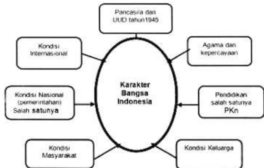
Gambar 1. Faktor-faktor yang mempengaruhi pengembangan atau pembentukan Karakter bangsa Indonesia

Pengembangan dan pembentukan karakter bangsa Indonesia sangat kompleks, dipengaruhi oleh beberapa faktor-faktor. Faktor yang mempengaruhi pengembangan dan pembentukan karakter bangsa Indonesia dapat dilihat dalam bagan ini: