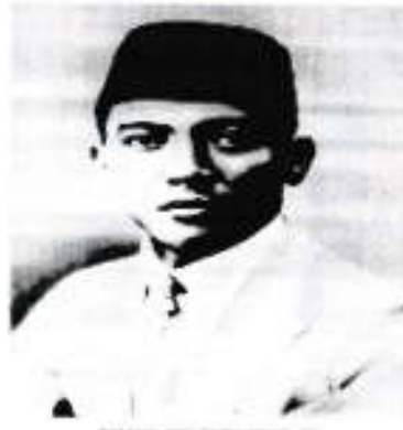
Bung Karno sebagai Model