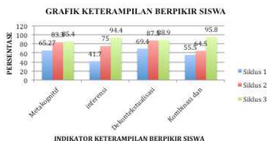
Gambar 7. Grafik Keterampilan Berpikir

Dari hasil penelitian tindakan penerapan model Learning Cycle untuk meningkatkan keterampilan berpikir siswa pada pembelajaran fisika di kelas X SMA Negeri 21 diperoleh hasil-hasil seperti terurai dalam gambar 7.