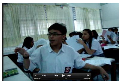
Gambar 5. Tahap Elaborasi