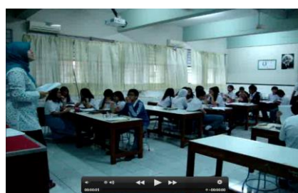
Gambar 4. Tahap Eksplanasi