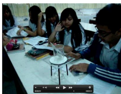
Gambar 3. Tahap Eksplorasi