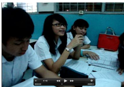
Gambar 6. Tahap Evaluasi