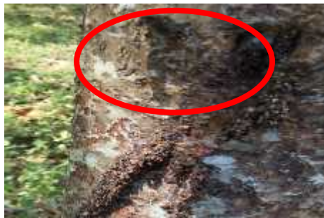
Gambar 5. Gejala serangan penggerek batang ( Zeuzera sp.) pada batang jabon

Pada lokasi hutan tanaman jabon di Desa Negara Ratu II Natar Lampung Selatan diketahui terdapat gejala serangan pada batang yang mengindikasikan serangan hama penggerek batang ( Zeuzera sp.) Indikasi serangan hama penggerek batang ( Zeuzera sp.) dapat dilihat pada Gambar 5.