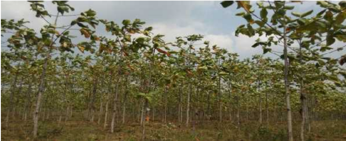
Gambar 1. Hutan tanaman jabon di Desa Negara Ratu II Kecamatan Natar, Kabupaten Lampung Selatan.