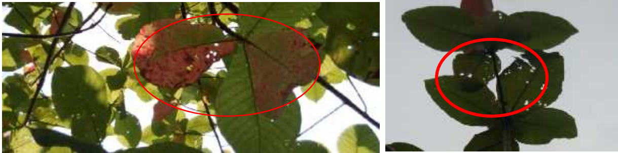
Gambar 2. Gejala kerusakan pada daun tanaman jabon

Serangan pada daun merupakan gejala gabungan dari serangan beberapa jenis hama sekaligus, salah satunya disebabkan oleh ulat kantong ( Mahasena cobetti ). Selain itu penelitian ini berlangsung pada musim kemarau (Juli sampai dengan September 2015) menyebabkan relatif tidak adanya pemulihan dari daun baru yang terbentuk.