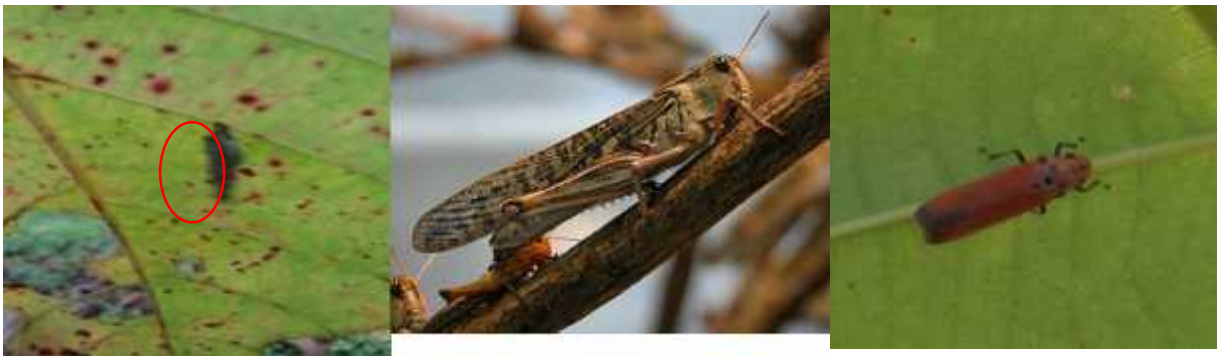
Gambar 4. Ulat kantong ( Mahasena corbetti ); belalang kembara ( Locusta migratoria ); dan wereng daun ( Bothrogonia sp. ) (berturut-turut dari kiri ke kanan)

Adapun pada penelitian di lokasi hutan rakyat tanaman jabon di Desa Negara Ratu II Natar Lampung Selatan telah mendapatkan 3 jenis hama perusak daun, yaitu ulat kantong ( Mahasena corbetti ), belalang kembara ( Locusta migratoria ), dan jenis wereng daun ( Bothrogonia sp. ) (Gambar 4).