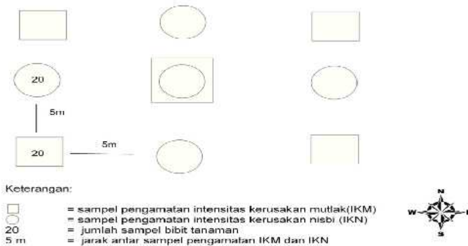
Gambar 1. Tata letak plot pengamatan IKM dan IKN.