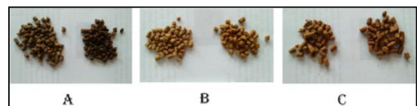
Gb 2. Perbedaan warna pelet dari masing-masing bahan setelah dan sebelum di lapsi putih telur

Untuk kondisi warna pelet, ternyata hasil yang didapat sama dengan warna pelet yang biasa di jual/komersial yaitu kecoklatan. Namun demikian terjadi sedikit perubahan warna antara pelet yang dilapsi dengan telur dan tidak. Pelet yang dilapsi telur cenderung warnanya lebih gelap di banding dengan yang tidak dilapsi dan hal ini disebabkan cairan putih telur yang menyerap dan menutupi permukaan pelet. Ada beberapa jenis ikan yang sifatnya memilih terhadap pakan yang diberikan dan sifat tersebut ternyata ada kaitannya dengan daya tarik dari pakan diantaranya dipengaruhi oleh bau, rasa dan warna (Mudjiman, 2008).