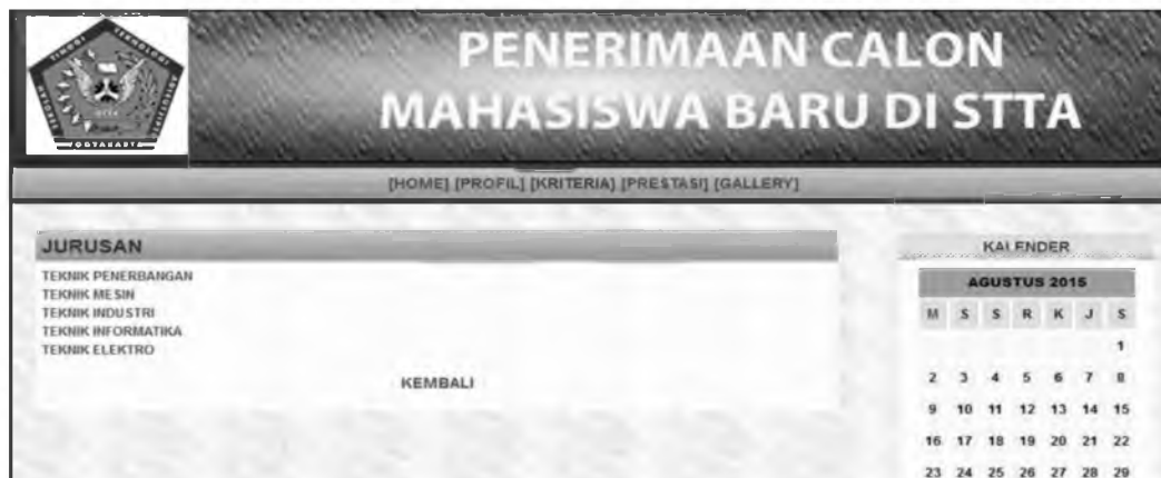
Gambar 3 Tampilan Halaman jurusan