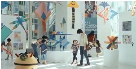
Gmb.1. Iklan Bebelac versi 4 'you are my

menonjolkan peran ayah seperti dalam iklan Oreo versi 'Pilih HP atau Oreo'. Peran ibu yang ditonjolkan tampak dalam iklan susu anak Bebelac dan iklan biskuit Roma yang menggambarkan keharmonisan seluruh anggota keluarga. Masing-masing iklan menonjolkan kekuatan produknya dengan mengusung tema keluarga.