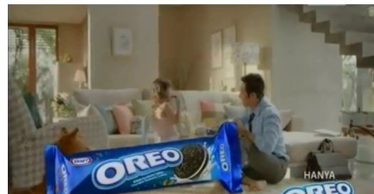
Gmb.3. Iklan Oreo versi 'pilih HP atau Oreo'