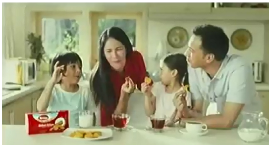
Gmb.2. Iklan biskuit Roma versi ' Roma biskuit kelapa '

Namun iklan Oreo yang menonjolkan peran seorang ayah di sana, berbeda dengan peran ibu dalam iklan susu anak Bebelac . Pada iklan Oreo ini, seorang ayah lebih diperlihatkan asik dengan HP ( gadget ) dibanding dengan putrinya,