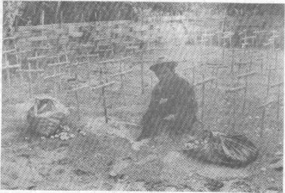
Gambar 1. Penggalan sarang buatan (semi-alamiah) di dalam kandang sarang oleh petugas lapangan di pantai Sukamade.