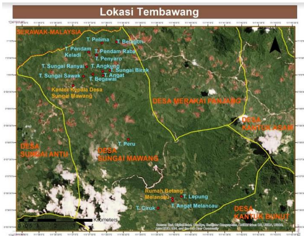
Gambar 1 Lokasi tembawang yang ada di Dusun Sungai Mawang

Berdasarkan famili/suku tumbuhan yang paling banyak dimanfaatkan adalah Moraceae (11 jenis), Anacardiaceae (9 jenis), Euphorbiaceae (7 jenis), Fabaceae (6 jenis) dan Apocynaceae (5 jenis). Dari famili Moraceae sebanyak delapan jenis dimanfaatkan sebagai tumbuhan pangan yaitu, cempedak ( Artocarpus integer (Thunb.) Merr.), sukun ( Artocarpus altilis (Parkinson ex F.A. Zorn) Fosberg), nangka ( Artocarpus heterophyllus Lam.), pingan ( Artocarpus odoratissimus Blanco), entawa ( Artocarpus anisophyllus Miq.), tekalong ( Artocarpus elasticus Reinw. Ex Blume) dan dadak ( Artocarpus lacucha Buch. -Ham.). Sementara itu tiga jenis lainnya dimanfaatkan sebagai obat yakni kundang ( Ficus fistulosa Reinw. Ex Blume), kayu ara ( Ficus benjamina L.) dan tabau ( Ficus variegata Blume).