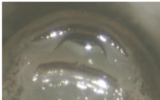
Gambar 1. Morfologi berudu Bufo melanostictus (A) Dorsal (B) Ventral (C) Oral disc.