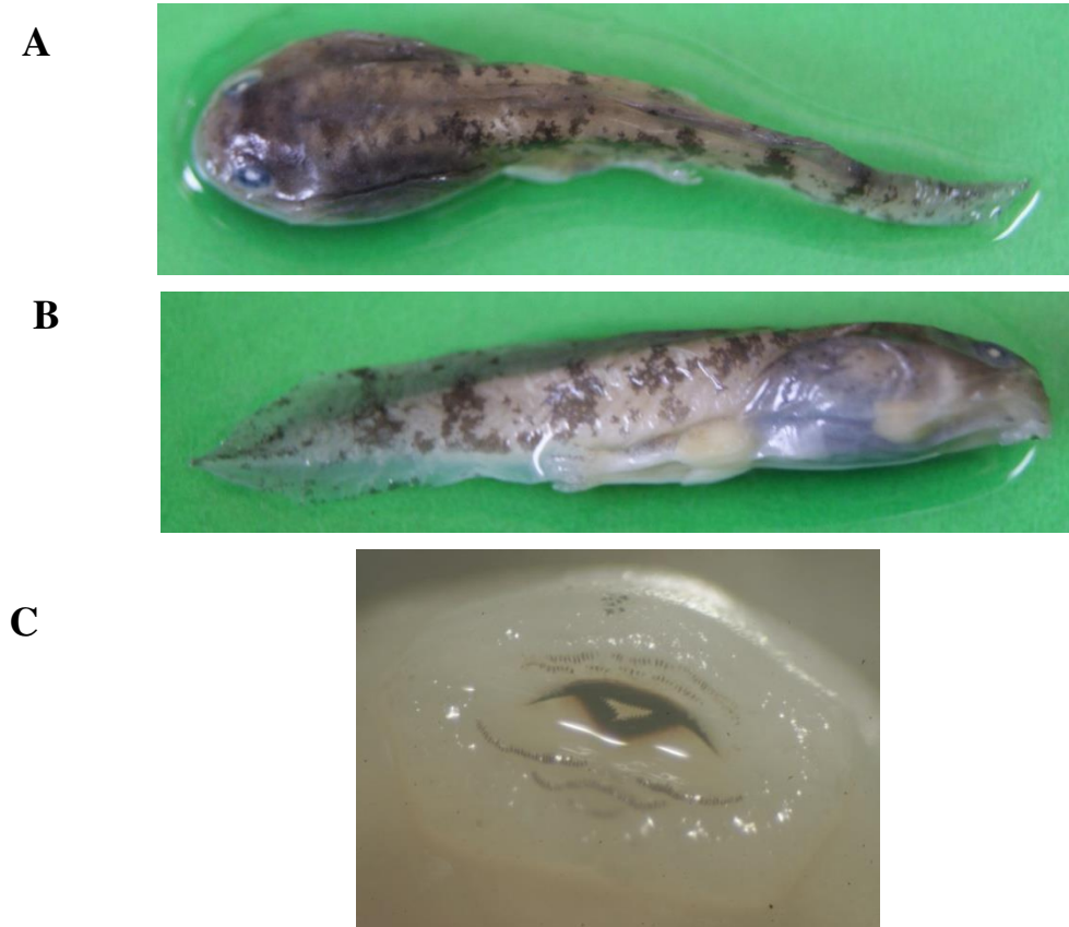
Gambar 2. Morfologi berudu Limnonectes sp. (A) Dorsal (B) Ventral (C) Oral disc.