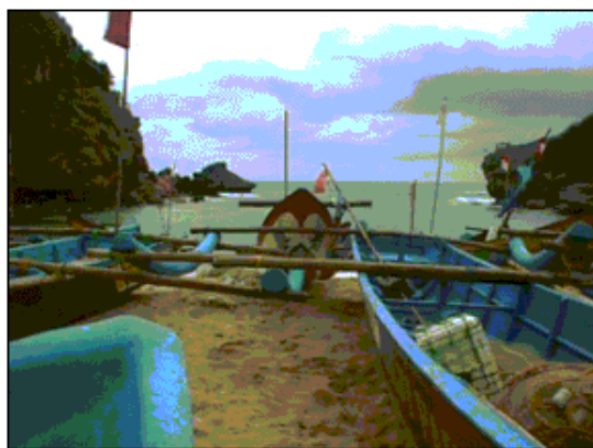
Gambar 3. Daerah berpotensi tsunami (Lokasi: Teluk Ngerenehan, 2002)

Kawasan Pantai dari Parangtritis ke arah barat, yang memiliki morfologi landai, dengan gumuk-gumuk pasir, yang didominasi oleh garis pantai lurus. Letak pemukiman umumnya berada di belakang gumuk pasir, membuat daerah ini relatif aman terhadap landaan gelombang tsunami. Hal ini ditunjang dengan keberadaan pelindung alami maupun buatan sangat membantu dalam rangka menjaga kelestarian kawasan pantai sekitarnya. Seperti keberadaan hamparan terumbu karang, gumuk-gumuk pasir, bangunan penghalang ( seawall ), dinding pantai dan pemecah gelombang.