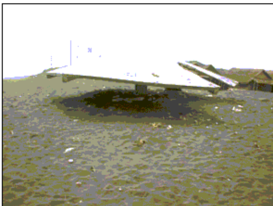
Gambar 5. Gumpuk Pasir yang Menutupi Bangunan Pantai (Lokasi : Pandansimo, 2002)

Proses sedimentasi/pendangkalan juga dijumpai di Teluk Sadeng. Pendangkalan tersebut disebabkan oleh aktifitas manusia, yaitu adanya penghalang gelombang yang dibuat di mulut teluk, menyebabkan sedimen terperangkap di sekitar kolam pelabuhan (Gambar 6). Oleh sebab itu, penataan pendangkalan di Teluk Sadeng harus dilakukan dengan menanggulangi proses erosi dan transportasi sedimen asal darat