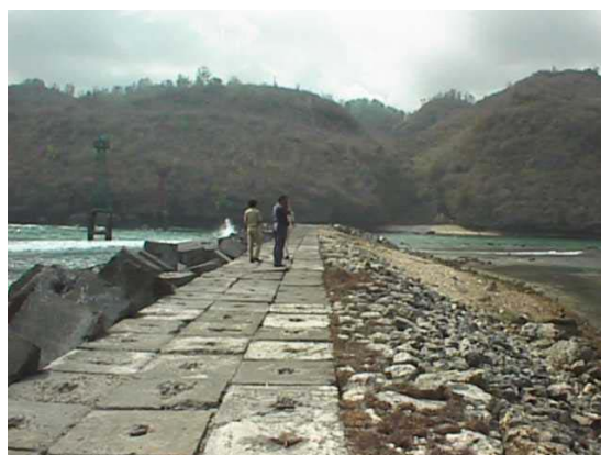
Gambar 6. Bangunan penghalang pantai yang menyebabkan pendangkalan (Lokasi : Teluk Sadeng, 2002)

yang memasuki kawasan Pelabuhan Teluk Sadeng.