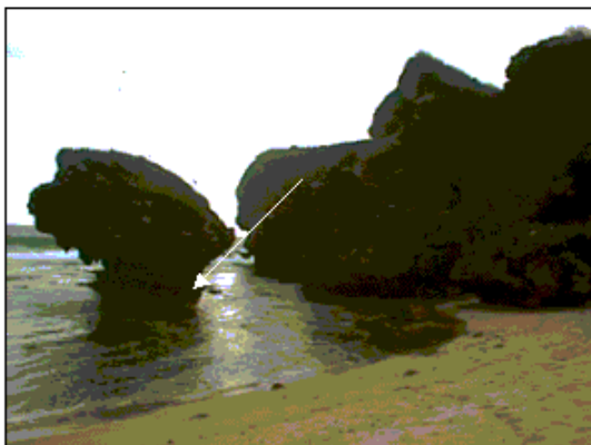
Gambar 4. Jatuhan Batuan Akibat Pengikisan Air laut (Lokasi: Kukup, 2002)

Batuan penyusun pantai di kawasan ini umumnya adalah batugamping terumbu yang bersifat masif, namun adanya pengikisan air laut terhadap batugamping tersebut, meninggalkan lubang di bagian tengah batuan, yang kadang terpotong sebagian (Gambar 4).