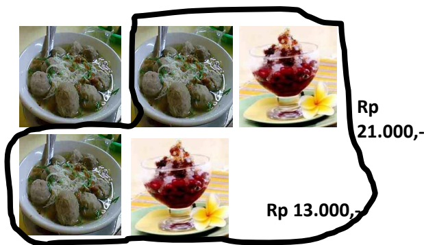
Gambar 5. Salah Satu Model Jawaban Siswa dari Masalah Makan di Kantin dalam LAS I

Siswa : Pak saya akan coba menjawabnya ... ini jawab saya Pak... [siswa memberikan jawaban di LAS I sebagaimana Gambar 5]