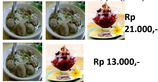
Gambar 4. Masalah Makan di Kantin dalam LAS I

[Guru Memberikan Lembar Aktivitas Siswa (LAS) yang isinya sebagai berikut.]