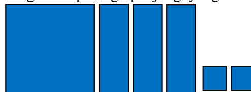
Gambar 2 Persegi dan Persegi Panjang yang ekuivalen dengan x^2+3x+2

Berdasarkan luasan daerah di atas, kemudian siswa diminta mengelompokkan persegi dan persegi panjang yang ekuivalen dengan luas daerahnya ruas kiri dari persamaan kuadrat x^2+3x+2 = 0 . Siswa kemudian mengelompokkan persegi dan persegi panjang yang ekuivalen dengan x^2+3x+2