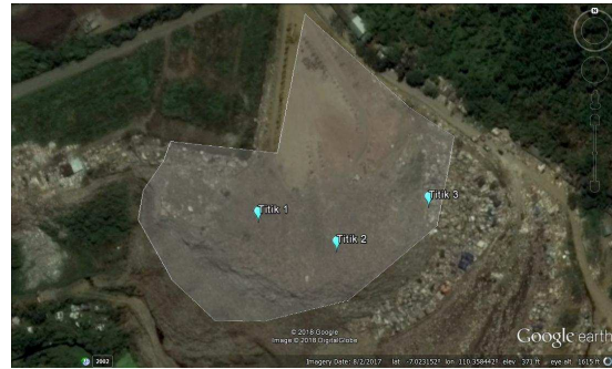
Gambar 2.1 Titik Pengambilan Sampel pada Zona Aktif 1 TPA Jatibarang

laboratorium pada suhu 105^\circ\text{C} , sampah tersebut kemudian dicacah dan diambil uji bom kalorimeter di laboratorium.