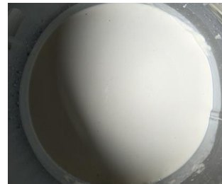
Gambar 10. Tekstur Adonan Lebih Halus dengan Alat Standing Mixer

mampu menyingkat proses pembuatan adonan kue jepit (hanya + 15 menit) dengan tekstur adonan lebih halus (Gambar 10). Dampaknya setelah dipanggang dan dicetak, kue jepit yang dihasilkan pun memiliki tekstur lebih empuk dan lembut.