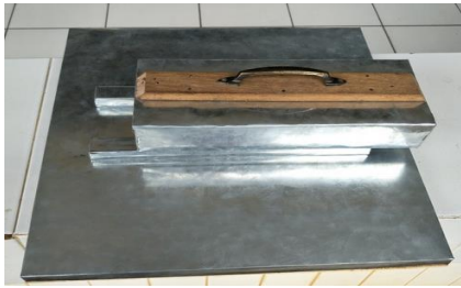
Gambar 12. Alat Press Kue Jepit

jepit dengan ketebalan lebih ramping, rapat dan seragam (Gambar 13).