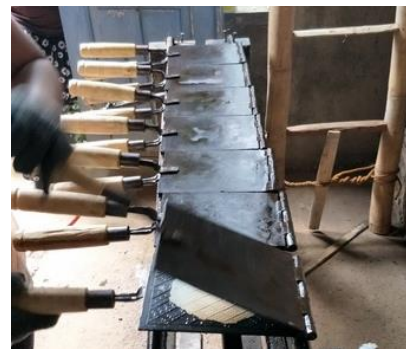
Gambar 11. Satu Set (7 Buah) Alat Cetak Kue Jepit