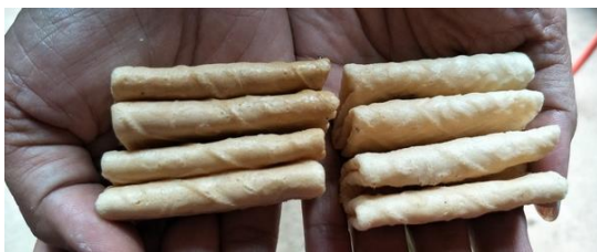
Gambar 13. Kue Jepit Hasil Press dengan Alat Baru Lebih Ramping dan Rapat (Kiri) Dibandingkan dengan Alat Press Lama (Lebih Lebar, Tidak)

5. Tersedianya kompor pemanggang kue jepit khusus dengan pemanasan di bagian tengah yang lebih merata (Gambar 14).