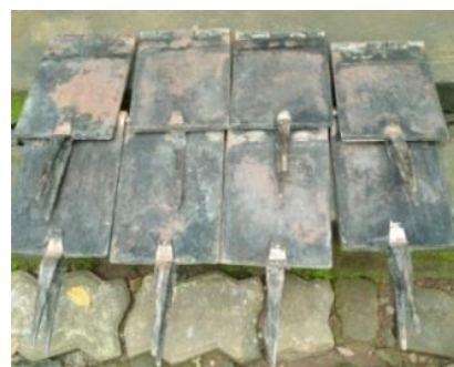
Gambar 2. Alat Pencetak Kue Jepit yang Rusak

Saat ini kapasitas produksi kue jepit IRT ini adalah 10 bal/hari dengan berat per bal + 3 kg. Kapasitas produksi ini menurun jika dibandingkan 2-4 tahun sebelumnya yang bisa mencapai 20 bal/hari. Hal ini dikarenakan teknologi pembuatan adonan kue jepit hanya menggunakan alat kocok swederhana sehingga memerlukan tenaga cukup besar dan waktu cukup lama untuk pembuatan adonan yang kalis (+ 20 kg untuk sekali pembuatan). Selain itu, lebih dari separuh alat cetak kue jepit telah rusak (lepas/patah kayu atau besi pegangannya dan berkarat (Gambar 2).