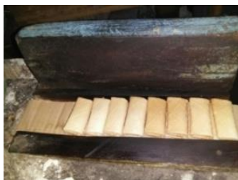
Gambar 4. Tempat Pressing Kue Jepit dari Kayu dan Alas Karton