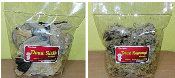
Gambar 1. Keripik sayur “Berkah Zahran” masih mengandung minyak yang terlihat membasahi keripik dan plastik kemasan.

bentuk dan tebal irisan kurang seragam. Selain itu, wajan penggorengan kecil dengan pemanas kompor gas rumahan, dan keripik tidak tahan lama atau mudah melempem dan cepat tengik karena masih mengandung minyak (Gambar 1). Hal ini membuat masa simpannya relatif pendek sekitar sebulan.