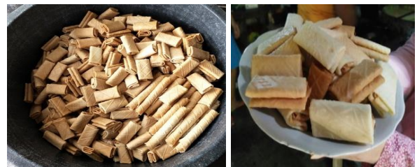
Gambar 15. Warna Coklat Kue Jepit Hasil Pemanggangan dengan Kompor Baru Lebih Seragam (Kiri) Dibandingkan dengan Kompor Lama (Kanan)

beragam: putih (pucat) hingga coklat tua, maka kue jepit hasil pemanggangan dengan kompor hasil program IbM memiliki warna yang jauh lebih seragam (kecoklatan semua) sehingga warnanya lebih menarik (Gambar 15).