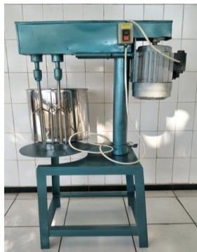
Gambar 9. Alat Standing Mixer

Jika dibandingkan dengan menggunakan alat kocok manual yang digunakan mitra selama ini (perlu waktu + 2,5 jam), penggunaan standing mixer terbukti