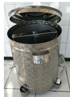
Gambar 8. Alat Peniris Minyak ( Spinner )

4. Tersedianya alat spinner yang berfungsi untuk meniriskan kandungan minyak dari keripik sayur dengan menggunakan sistem putaran (Gambar 8). Penggunaan mesin spinner terbukti sangat membantu dalam mengurangi kandungan minyak pada keripik sayur setelah digoreng, sehingga dapat meningkatkan mutu keripik sayur (lebih higienis, dapat mengurangi kandungan lemak/kolesterol) dan meningkatkan nilai keawetan (renyah, tidak cepat melempem) produk keripik.