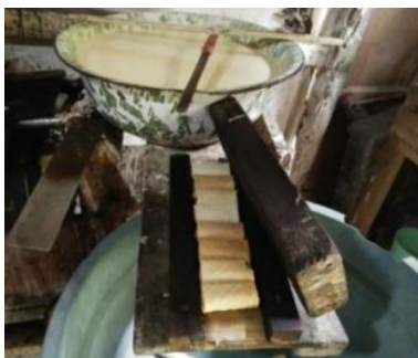
Gambar 3. Proses Pelipatan Kue Setelah Matang pada Kondisi Masih Panas (Atas) dan Pressing (Penindihan) Kue Setelah Dilipat (Bawah).