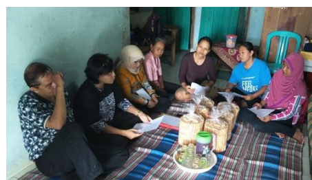
Gambar 19. Kegiatan Penyuluhan dari Tim IbM kepada SDM IRT Kue Jepit di RT 01/RW 05 Kelurahan Pudukpayung, Semarang