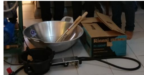
Gambar 7. Wajan Besar dan Kompor High Pressure

kering dan renyah (kadar air sangat rendah).