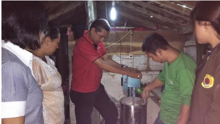
Gambar 20. Kegiatan Pelatihan dan Praktek Pengoperasian Alat Standing Mixer dari Tim IbM kepada SDM IRT Kue Jepit