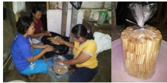
Gambar 5. Poses Pengemasan (Kiri) dan Hasil Kemasan Produk Kue Jepit (Kanan)

Dengan melihat permasalahan yang dihadapi IRT kue jepit maka perlu diberikan penerapan teknologi pecampuran adonan dengan alat pencampur ( mixer ), penggantian alat pencetak kue yang rusak dan alat pressing kue yang kurang layak, dan pengemasan produk yang menarik ( labeling ).