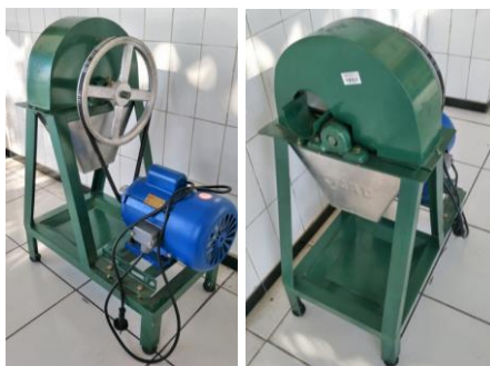
Gambar 6. Alat Perajang ( Slicer )

berupa motor listrik berkekuatan \frac{1}{2} HP (Gambar 6). Mesin slicer digunakan untuk merajang bahan sayur untuk keripik, seperti pare, terong, dan wortel, menjadi irisan dengan ketebalan sama antara 0,5 - 3 mm. Dengan empat buah pisau perajang, mesin slicer terbukti mampu mengiris bahan 4 kali lebih cepat (kapasitas 50 kg/jam) bila dibandingkan dengan perajangan menggunakan pisau maupun perajang sederhana dari kayu dengan 1 mata pisau yang digunakan mitra selama ini.