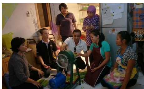
Gambar 17. Kegiatan Pelatihan dan Praktek Pengoperasian Alat Perajang ( Slicer ) dari Tim IbM Kepada SDM IRT Keripik Sayur