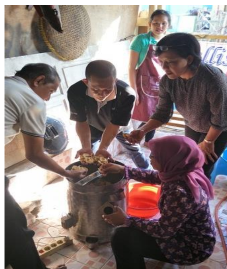
Gambar 18. Kegiatan Pelatihan dan Praktek Pengoperasian Alat Peniris Minyak ( Spiner ) dari Tim IbM kepada SDM IRT Keripik Sayur