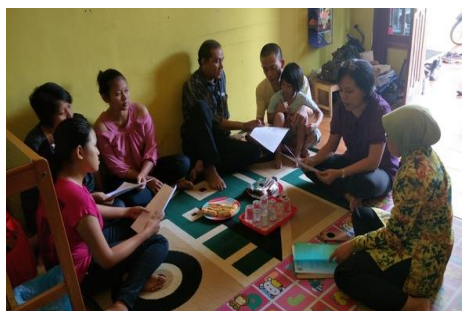
Gambar 16. Kegiatan Penyuluhan dari Tim IbM kepada SDM IRT Keripik Sayur Berkah Zahran

Hasil pelaksanaan program IbM yang telah berjalan dapat ditunjukkan pada gambar sebagai berikut.