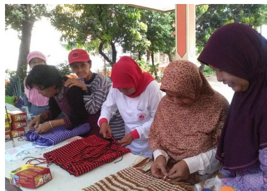
Gambar 4. Suasana Pelatihan

kursi, kap lampu, tutup galon air mineral dan tas. Selain menghasilkan luaran berupa produk-produk kerajinan juga membuat media promosi yang digunakan untuk membantu memasarkan produk-produk kerajinan tersebut. Media promosi yang dihasilkan berupa standing banner dan brosur. Kedua media promosi ini diharapkan di-display ketika ibu-ibu Karang Weda Wiguna Karya Kelurahan Kebonsari Surabaya mengikuti pameran produk unggulan daerah, salah satu pameran yang telah diikuti adalah Road Show Pahlawan Ekonomi di Sentra PKL Kecamatan Jambangan.