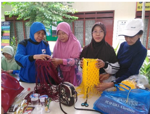
Gambar 3. Suasana Pelatihan

Mulai kegiatan sosialisasi hingga kegiatan pelatihan selama enam kali pertemuan berjalan dengan lancar. Berjumlah 10 orang peserta yang kesemuanya adalah ibu-ibu anggota Karang Weda Wiguna Karya Kelurahan Kebonsari Kecamatan Jambangan Surabaya menghadiri kegiatan dengan baik. Dilihat dari ketersediaan bahan hingga, pelatihan, dan proses finishing, semua tidak mengalami halangan apapun.