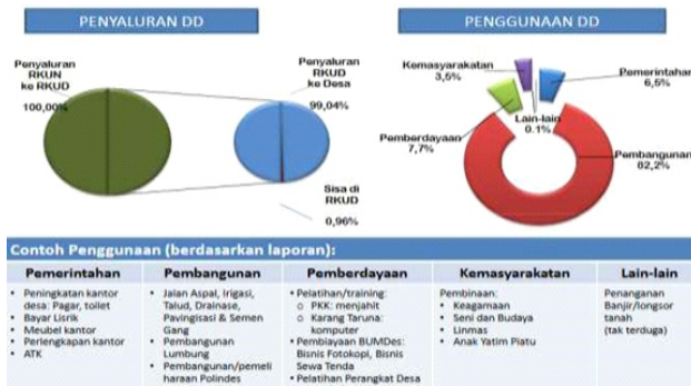
Gambar 2. Realisasi Dana Desa

umum tata cara pelaporan dan pertanggungjawaban penyelenggaraan pemerintah desa, yang dimuat dalam Peraturan Menteri Dalam Negeri No. 35 Tahun 2007. Dalam perjalanannya seiring dengan perkembangan otonomi desa maka pengaturan keuangan desa mengalami perubahan.