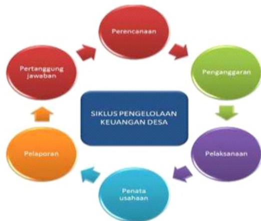
Gambar 4. Siklus Pengelolaan Keuangan Desa

Keuangan desa dikelola berdasarkan praktik-praktik pemerintahan yang baik. Asas-asas pengelolaan keuangan desa sebagaimana tertuang dalam Permendagri Nomor 113 Tahun 2014 yaitu transparan, akuntabel, partisipatif serta dilakukan dengan tertib dan disiplin anggaran.