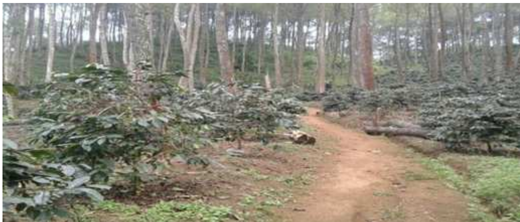
Gambar 1 Kondisi Perkebunan Kopi Arabika Di Daerah Penelitian

Buah kopi arabika yang dipanen diolah dengan pengolahan proses basah, buah kopi hasil panen disortasi terlebih dahulu untuk memilah antara kopi yang sudah matang sempurna dengan buah kopi yang belum matang, kemudian dikeringkan sampai didapat gabah kering kopi arabika dengan penyusutan sebesar 65% sehingga tiap 100 kg buah kopi (gelondongan), menghasilkan sekitar 35