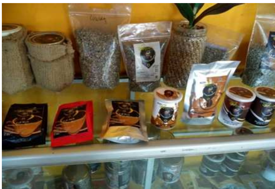
Gambar 3 Inovasi Produk Olahan Kopi Arabika di Desa Suntenjaya