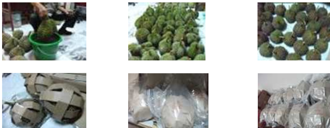
Gambar 1. Pencelupan dalam larutan anti mikroba (a); durian setelah pencelupan dalam anti mikroba (b); durian setelah pelilinan (c); pembungkusan duri durian sebelum dikemas MA dan vakum (d); pengemasan MA (e); pengemasan vakum (f).

Figure 1. Dipping in the antimicrobial solution (a); durian fruits after dipping in the antimicrobial solution (b); durian fruits after waxing (c);wrapping durian fruits before MA and vacuum packaging (d); MAP (e); vacuum packaging (f).