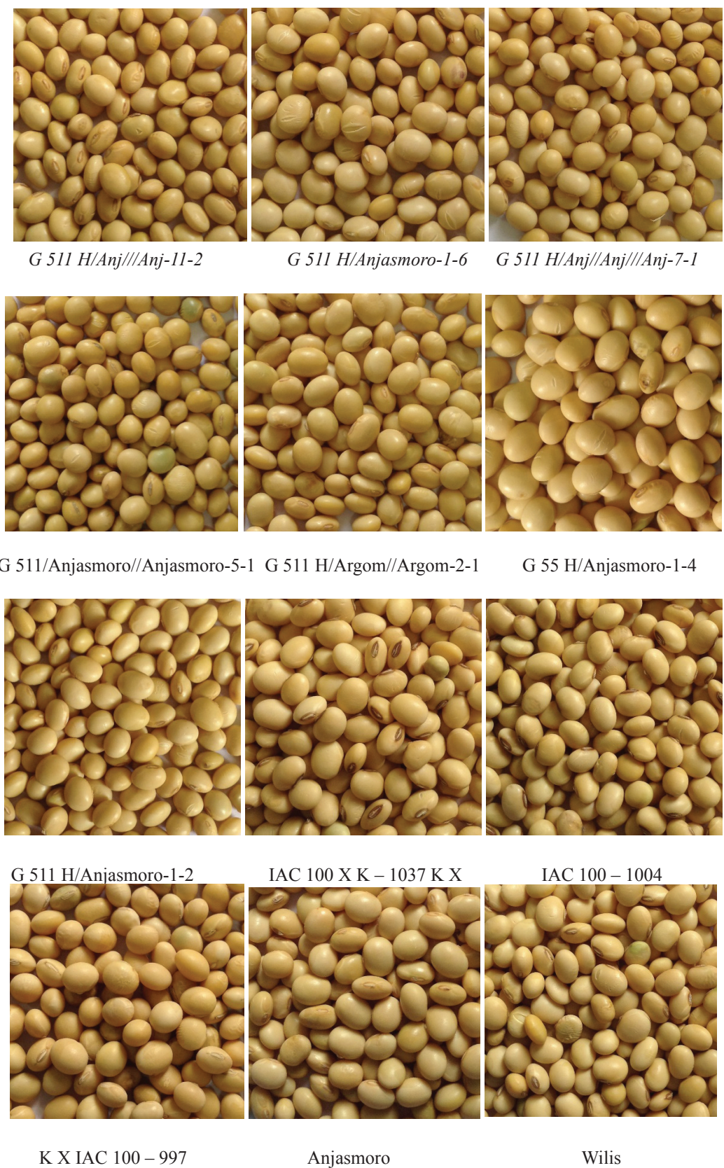
Gambar 2. Biji kedelai dari sepuluh galur harapan dan dua varietas pembanding. Figure 2. Ten promising lines and two comparison varieties of soybean seeds.