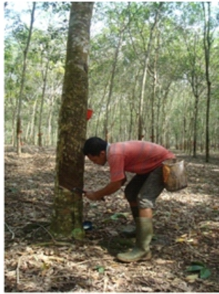
Gambar 5. Penyadapan pada panel BO-1 bawah tanaman karet Figure 5. Tapping on lower BO-1 panel of rubber tree