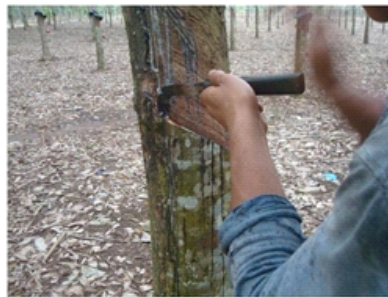
Gambar 7. Sodokan depan mata pisau Figure 7. Push movement of the manual tapping knife