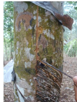
Gambar 9. Sodokan pada sadap ke arah atas Figure 9. End pushing of the upward tapping