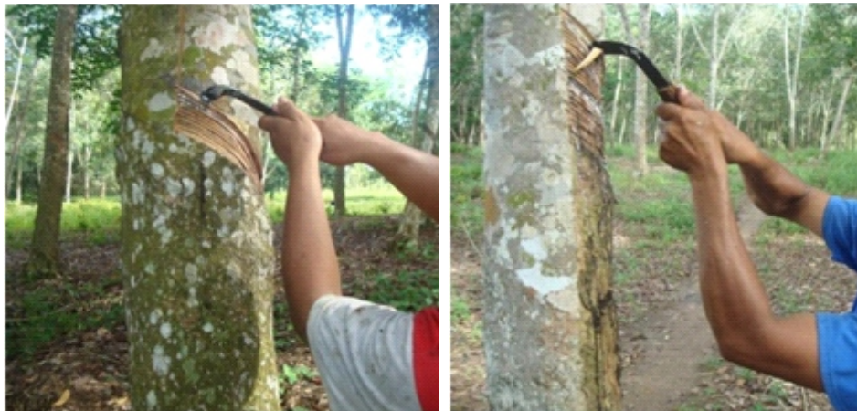
Gambar 10. Sadap ke arah atas yang tidak tepat Figure 10. Uncorrect upward tapping

digerakkan dengan disorong, bukan ditarik. Akibatnya irisan tersebut tidak menghasilkan tempat sodokan sehingga jumlah atau produksi lateks yang dihasilkan akan lebih sedikit. Bekas parit sadapan ujung atas akan terlihat landai atau dangkal dan konsumsi kulit akan lebih tebal atau boros.