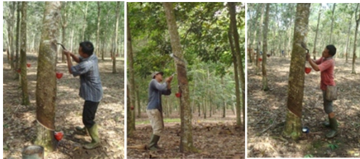
Gambar 6. Penyadapan pada panel HO tanaman karet Figure 6. Tapping on HO panel of rubber tree