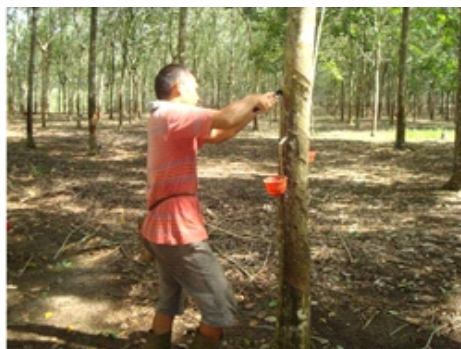
Gambar 4. Penyadapan pada panel BO-1 dan BO-2 tanaman karet Figure 4. Tapping on BO-1 and BO-2 panels of rubber tree

Hal yang harus diperhatikan dalam mengoptimalkan potensi produksi tanaman karet yaitu cara mengiris kulit harus terjadi sodokan dengan sisi mata pisau bagian depan yang diperlihatkan pada Gambar 7, sisi mata pisau belakang tepat berhenti pada batas sadap yang diperlihatkan pada Gambar 8, kedalaman irisan dipertahankan hingga 1,5 mm dari kambium dan pada sadap ke arah atas juga terdapat sodokan mata pisau sisi depan yang diperlihatkan pada Gambar 9. Cara mengiris pada sistem sadap ke arah yang tidak tepat ditunjukkan pada Gambar 10. Pisau sadap seharusnya