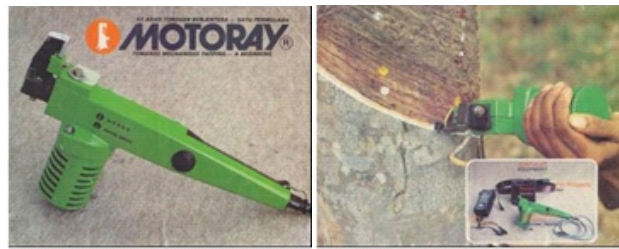
Gambar 1. Pisau sadap mekanis Motoray dan pengoperasiannya Figure 1. Mechanical tapping knife "Motoray" and its operational