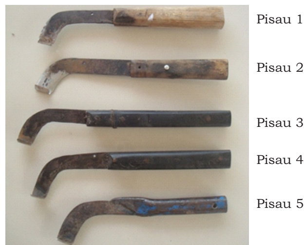
Gambar 3. Berbagai model pisau sadap manual Figure 3. Various model of manual tapping knives

Gambar 3 memperlihatkan kelima pisau sadap yang diuji di lapangan. Hasil pengujian dimensi pisau sadap secara lengkap disajikan pada Tabel 1. Berdasarkan Tabel 1 terlihat bahwa berat pisau sadap manual antara 120-190 gram. Material gagang secara signifikan menambah berat pisau sadap manual. Gagang pisau sadap tersebut terbuat dari kayu, arnit dan pipa besi. Berdasarkan respon balik dari masing-masing penyadap diketahui bahwa contoh pisau sadap manual nomor 5 yang bergagang besi kurang nyaman digunakan karena terasa licin di tangan dan gagang pisau terlalu pendek. Adapun panjang tangkai besi hingga mata pisau tidak berbeda jauh yaitu antara 9-13 cm. Secara umum dapat diketahui bahwa bentuk pisau sadap manual berbeda pada