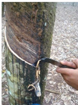
Gambar 8. Batas tarikan mata pisau Figure 8. End cutting downward tapping