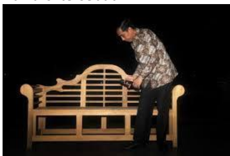
Gambar 3 Elemen Grafik berupa foto pada artikel 3

Elemen retorik yang mencolok terlihat ialah elemen gambar berupa foto yang ditambahkan. Walaupun foto ini didominasi dengan warna hitam gelap, foto ini tetap mencolok dengan sosok yang ada di dalamnya. Sosok tersebut adalah Joko Widodo, Presiden Republik Indonesia. Yang membuat sosok tersebut mencolok adalah posenya. Pose berdiri tidak sempurna, cenderung membungkuk dengan kedua tangan di depan perut memegang mikrophone. Dengan adanya kursi panjang yang ada di belakang Jokowi, sebenarnya bisa dimengerti bahwa pose yang tidak sempurna itu karena diambil ketika Jokowi hendak duduk dikursi tersebut.