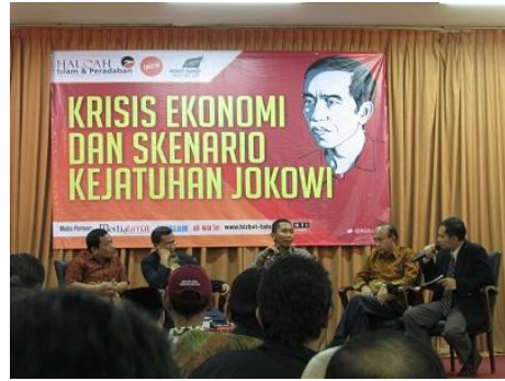
Gambar 2. Elemen Grafik berupa foto pada artikel 2

Foto yang disajikan dalam gambar 2 tersebut mempunyai peran penting dalam artikel. Perlu diingat, kalimat pembuka dalam artikel ini berupa pernyataan penyangkalan. Lantas apa yang disangkal dalam kalimat pembuka tersebut? Penyangkalan tersebut merujuk pada latar yang dihadirkan dalam foto ini. Foto tersebut menggambarkan setting sebuah diskusi dengan backdrop besar bertuliskan tema “Krisis Ekonomi dan Skenario Kejatuhan Jokowi”. Peran backdrop diskusi ini yang ingin ditekankan, dengan warna merah mencolok dan dengan ukuran yang cukup besar mendominasi frame foto. Penulis artikel hendak memberikan latar dengan penggunaan foto ini, bahwa sedang terjadi diskusi mengenai krisis ekonomi yang sedang terjadi. Krisis ekonomi tersebut akan memunculkan skenario kejatuhan Presiden Jokowi. Kalimat “Skenario Kejatuhan Presiden Jokowi” membawa kesan kejatuhan presiden Jokowi adalah sebuah peristiwa yang dirancang dan diskusi ini sedang membahasnya.