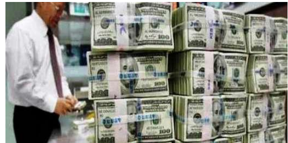
Gambar 1. Elemen Grafik berupa foto pada artikel 1

yang sedang dibangun oleh VOA-Islam untuk kembali mengangkat wacana historis tentang kerusuhan '98 ini.