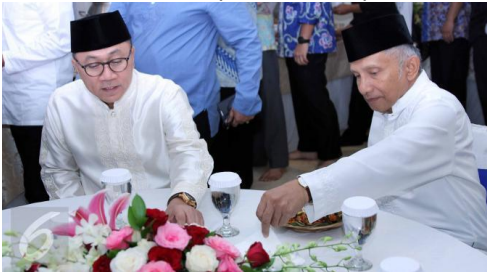
Gambar 4. Elemen Grafik berupa foto pada artikel 4

dua orang tokoh besar dari PAN. Dua orang tersebut adalah Zulkifli Hasan (kiri) dan Amien Rais (kanan). Dalam foto, kedua tokoh tersebut sedang duduk dalam sebuah meja makan bundar, layaknya pada jamuan makan. Mencermati pada sudut kiri bawah terdapat watermark logo Liputan6 , peneliti beranggapan foto tersebut disalin dari situs liputan6.com . Dari hasil penelusuran, peneliti menemukan foto asli yang diambil oleh Helmi Afandi dari liputan6.com . Foto tersebut diambil ketika Ketua MPR RI Zulkifli Hasan (kiri) dan politisi senior Amien Rais saat acara buka puasa bersama di kediaman Ketua MPR RI, di Jakarta, Kamis (25/6/2015).