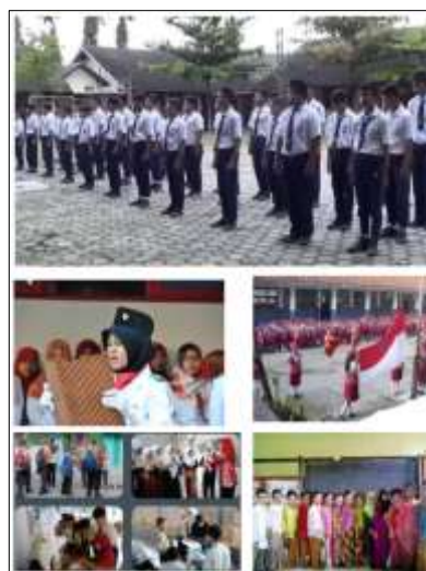
Gambar 3. Kegiatan Nilai Karakter Nasionalis

Secara umum, sekolah di Indonesia sudah berupaya melakukan inovasi-inovasi kegiatan penumbuhan nilai