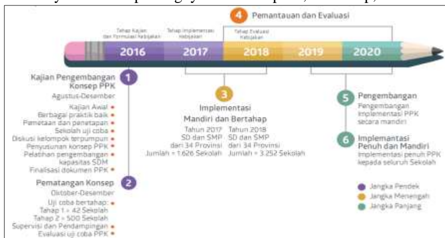
Gambar 1. Peta Jalan Implementasi PPK

Nilai karakter nasionalis adalah cara berpikir, bersikap, dan berbuat yang