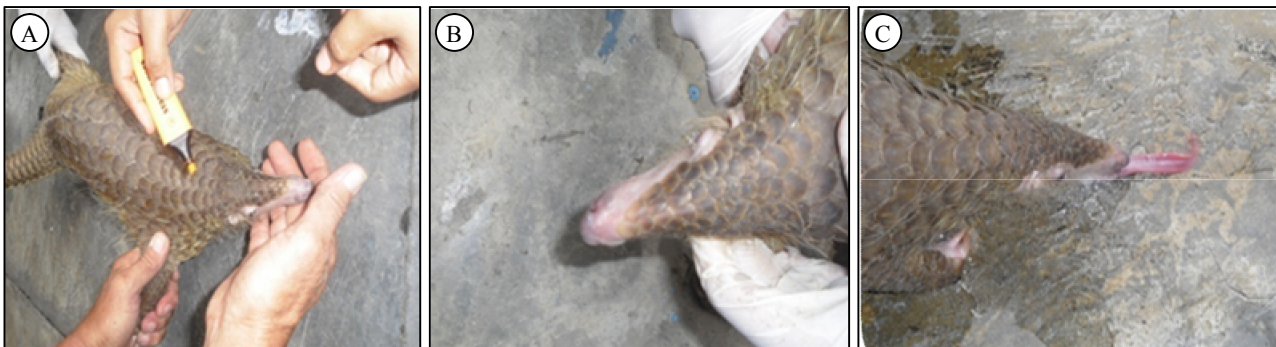
Gambar 1. Pengukuran morfometrik trenggiling jawa dari Sumatera. A = bentuk punggung, B = bentuk kepala, C = lidah trenggiling.

Trenggiling termasuk satwa plantigradi (Cahyono, 2008), yaitu menapakkan kakinya pada telapak tangan dan telapak kaki, di mana panjang