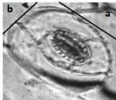
Gambar 2. Cara pengukuran panjang dan lebar sel stomata. (a) = panjang sel penjaga; (b) = lebar sel penjaga. (Measurement of length and width of stomata (a) length of guard cell (b) width guard cell)