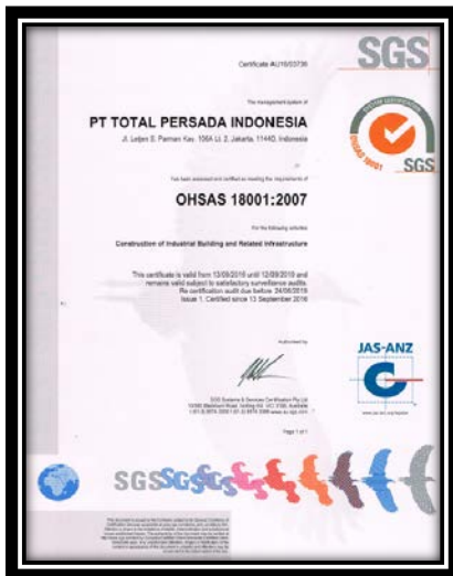
Gambar 8. Sertification OHSAS 18001:2007