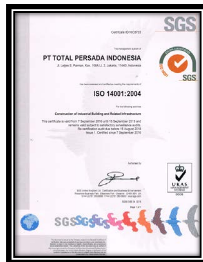
Gambar 6. Certification ISO14001:2004