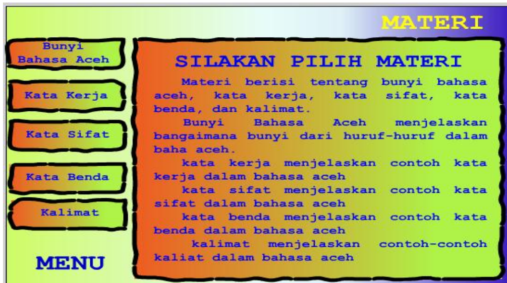
Gambar 3. Tampilan Menu Materi

Tampilan ini menampilkan materi tentang bahasa Aceh, bunyi bahasa Aceh, kata kerja, kata sifat, kata benda dan kalimat serta terdapat tombol menu untuk kembali ke menu utama.