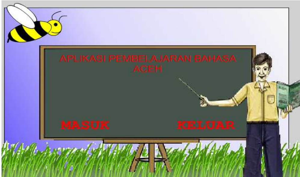
Gambar 2. Tampilan intro

Pada tampilan intro terdapat judul dan tombol mulai yang akan terhubung ke tampilan menu utama.